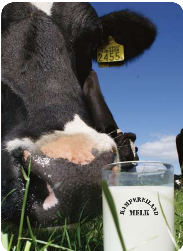
Kampereiland melk en zuivelproducten, streekproducten met toegevoegde waarde.

De Stadserven, eigenaar van gronden op het Kampereiland en omgeving (e.o.), geeft met het project Weidse Waarden een impuls aan het gebied. Het project biedt pachters een economisch en duurzaam perspectief. Boerenbedrijven worden versterkt, evenals andere belangrijke functies van het gebied.