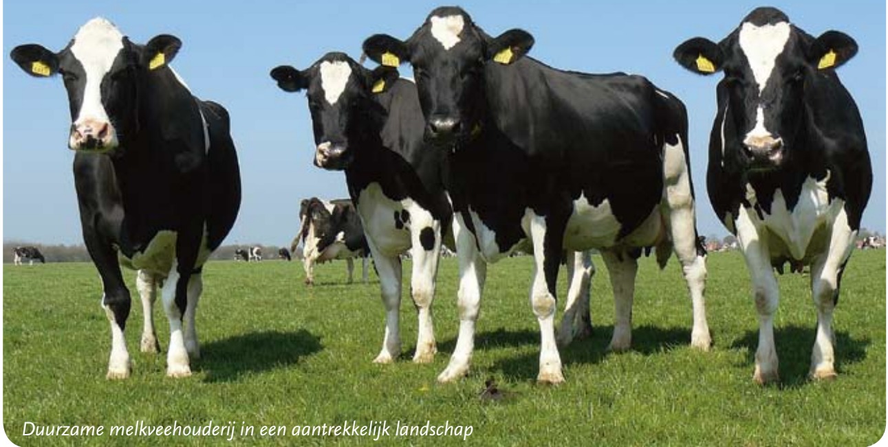
Duurzame melkveehouderij in een aantrekkelijk landschap