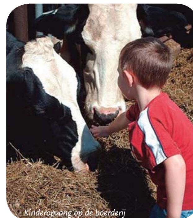
Kinderopvang op de boerderij